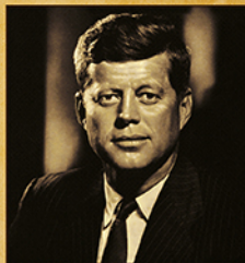
JOHN F. KENNEDY († 22 NOVIEMBRE 1963)