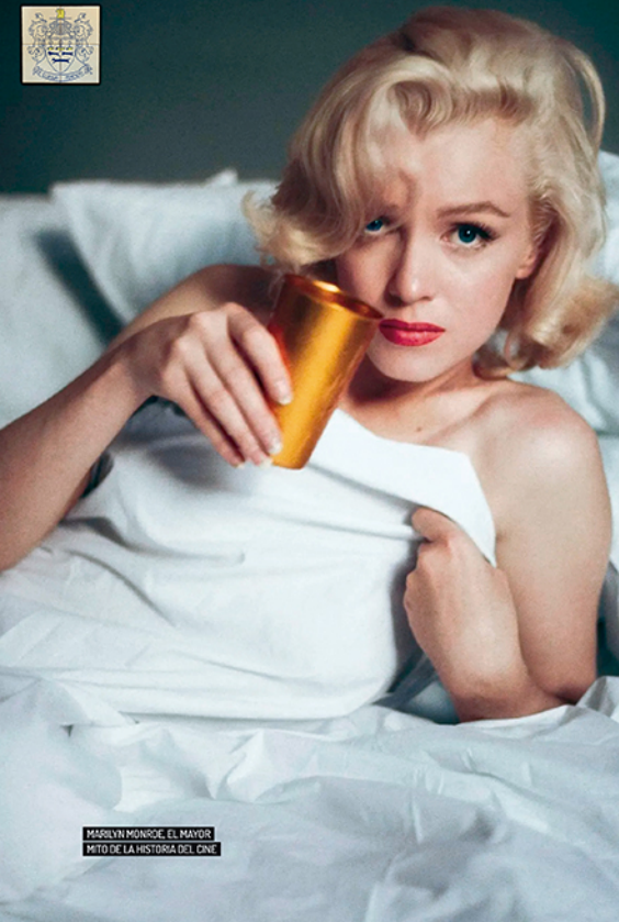
MARILYN MONROE. EL MAYOR MITO DE LA HISTORIA DEL CINE