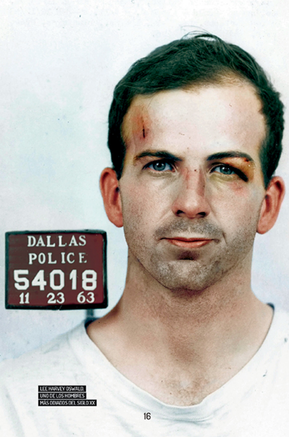
LEE HARVEY OSWALD. UNO DE LOS HOMBRES MÁS COMIZOS DEL SIGLO XX