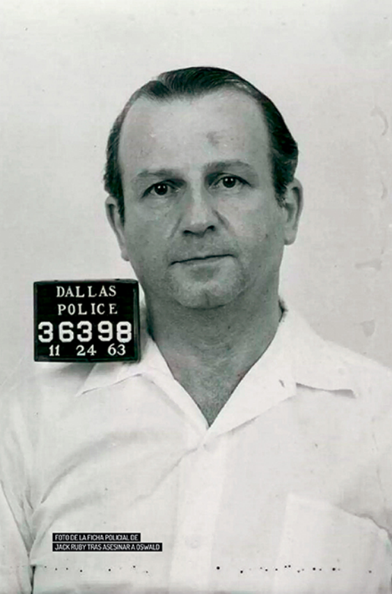
FOTO DE LA FICHA POLICIAL DE JACK RUBY TRAS ASESINAR A OSWALD