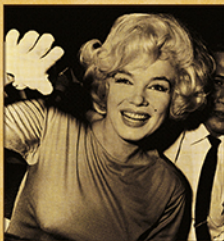
MARILYN MONROE († 64 AGOSTO 1962)

Los otros cadáveres del asesinato de JFK